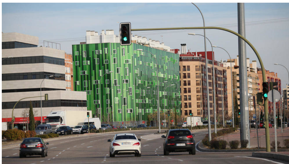
Pisos en Vallecas.

Un fondo del banco ha comprado el 5% de la sociedad inmobiliaria del Grupo Ortiz, que gestiona activos en alquiler con una ocupación media del 98%